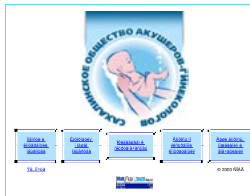
SSOG's website, http://soag.sakhalin.ru

В течение полутора лет участницы должны были раз в месяц отвечать на вопросы электронной анкеты о сексуальном поведении и применении контрацептивов. Подгруппу, составленную методом случайной выборки, попросили принять участие в 3 углубленных интервью. В 5000 автоматизированных телефонных интервью приняли участие 813 женщин, в то время, как 475 человек приняли участие в первом углубленном интервью, 363 – в еще одном интервью через 9 месяцев, и 315 – в последнем, спустя 18 месяцев после начала исследования. Предварительный анализ полученных данных показывает, что приблизительно 24% опрошенных в прошлом пользовались ЭК. В начале изучения почти 57% женщин, применявших ЭК, сообщили, что использовали этот метод из-за того, что не применялась плановая контрацепция; 32% сказали, что использовали его из-за проблем с презервативами; 8% – из-за проблем с оральными контрацептивами; и 3% указали сексуальное насилие как причину применения ЭК. Данные опросов и медицинских историй будут сравниваться для выявления различий в частоте беременностей и наличии инфекций, передаваемых половым путем, между пользующимися ЭК и теми, кто ее не применял.